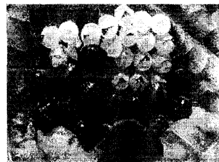
Larve -stadiul I -de plosnita cerealelor

Gandacul balos. Gândacul bălos are o singură generație pe an. Adulții rod frunzele plantelor tinere, perforandu-le sub forma unor dungi longitudinale scurte, paralele cu nervurile. Larvele rod epiderma superioara și parenchimul frunzelor, tot sub forma de dungi longitudinale, iar epiderma inferioara se usuca, albindu-se. Atacul se produce în vetre și se observa de la distanță. Ataca de obicei ovazul dar și orzul și alte graminee. Tratamentele se fac la avertizare împotriva insectelor adulte, înainte de depunerea oualor. Larvele se combat când au eclozat în majoritate, în primele stadii de dezvoltare.